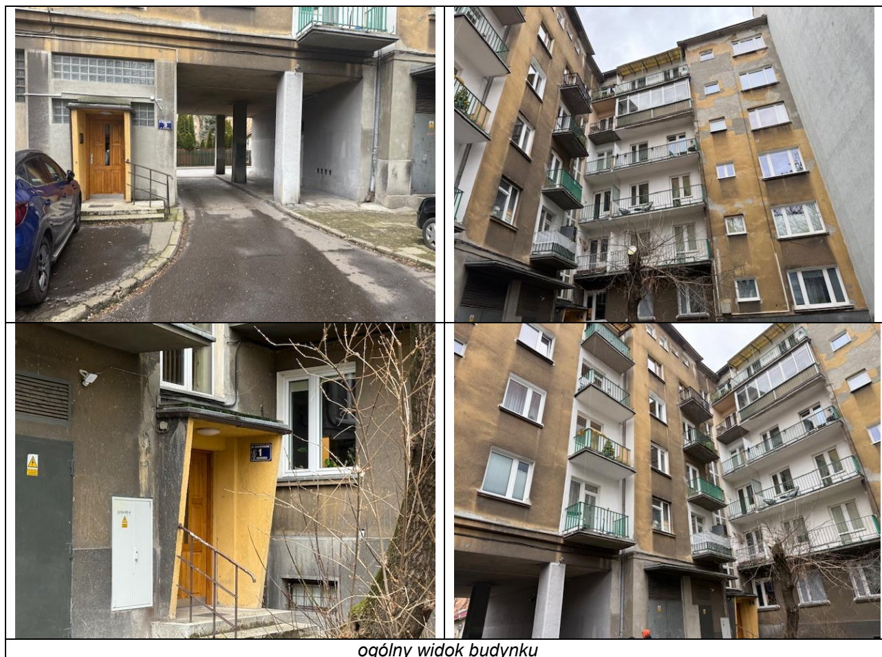
ogólny widok budynku

W dniu wizji lokalnej nieruchomość gruntowa zabudowana budynkiem wielolokalowym o funkcji mieszkalnej. Budynek 6-kondygnacyjny, wybudowany w 1958 roku, następnie nadbudowany o kondygnację, na której znajduje się wyceniany lokal, w 1993 roku. W budynku brak windy. Ściany zewnętrzne murowane, otynkowane, elewacja wymaga remontu. Dach pokryty papą. Stolarka okienna drewniana. Drzwi wejściowe do klatki schodowej od tyłu budynku, po przejściu od strony podwórka, drewniane. Balustrady stalowe malowane. Części wspólne wykończone w przeciętnym standardzie – na podłogach lastrico, na ścianach powłoki malarskie. Teren wokół budynków zagospodarowany (chodniki, podjazd, parking), trawniki, zieleni pielęgnowana – nie stanowiący części wspólnych. Działka pod budynkiem pokrywa się z jego obrysem. Budynek wyposażony w następujące instalacje: wod-kan., elektryczną, gazową, MPEC, teletechniczną.